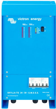
Skylla TG 24 30 GMDSS