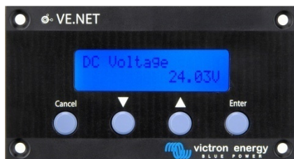
Tableau d'affichage GMDSS

Le tableau permet un accès facile à toutes les valeurs importantes. Les niveaux d'alerte sont pré paramétrés mais modifiables. Affichage en langue anglaise.