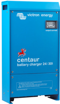
Centaur Battery Charger 24 30